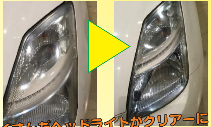
くすんだヘッドライトがクリアーに