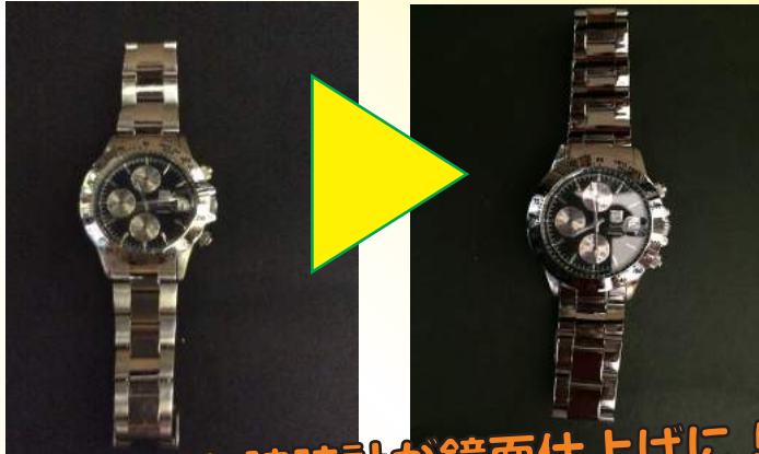
使い古した腕時計が鏡面仕上げに！ ※ルーターを使用

はじめての方でもプロ級の仕上がりを！輝きを取り戻して大事なものをいつまでも大切に！！