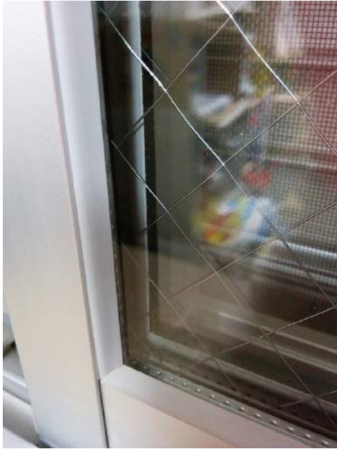
○コート面をキレイにします。