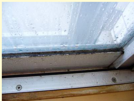
※ 結露によるサッシのパッキンもカビの巣窟

コートワークスJは外壁や水回りに使われる防水パッキン・コーキングを、施工当時のままの美しさに保つ、特殊コーティング剤です。風雨にさらされることが必須な外壁や、湿気によりカビの巣窟になりがちなお風呂場のコーキング（目地）。どんなに気を配っていてもお手入れ、掃除には限度があります。