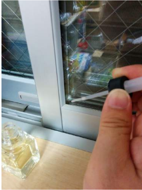
○キャップの刷毛でムラなく塗ります。