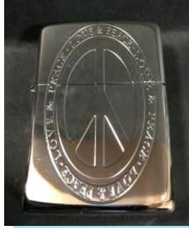
ジュエリーやシルバーに