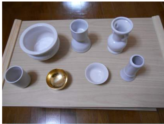
なんとセトモノにもコートが出来ます