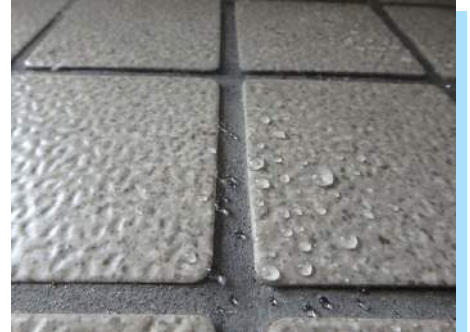
タイルへの撥水効果はバツグン！