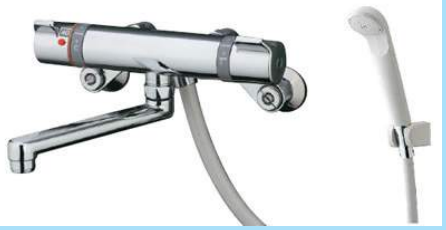
水回りのメッキの輝き保持に