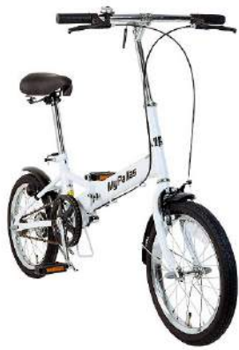
屋外で使う自転車の錆び止めに