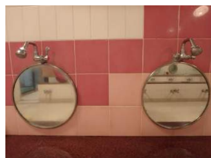
隣の鏡と一目瞭然です。