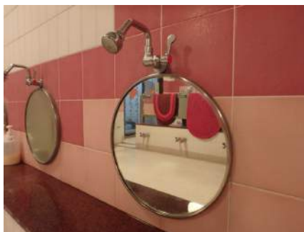
30分間固着させコートが完成です。