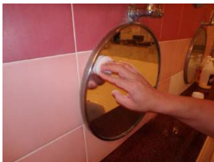
続いてアンチフォグ・ミラーを塗ります。