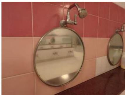
曇っている一つの鏡に施工します。