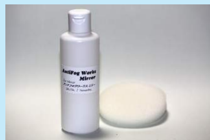
専用スポンジ付き