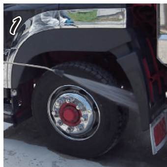
① 施工面を洗浄します