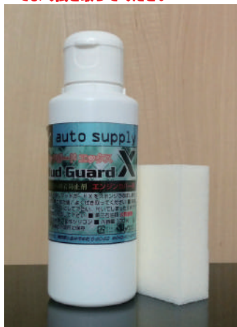
エンジンカバー用