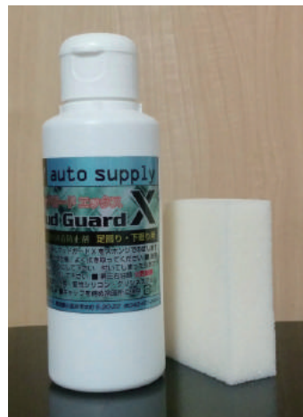
足回り・下廻り用