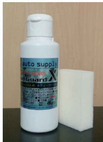
ボディ・ガラス用