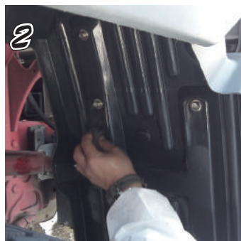
② 施工部にスポンジでのぼします