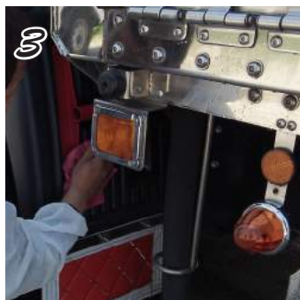
③ 15分ほど乾燥させた後、濡れたウェスでよく拭き取ってください