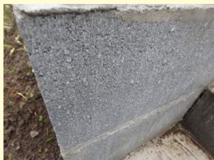
※ブロック塀にも使えます。

コートワークスピーは石材（大理石・御影石）に塗布することで表面から浸透し吸水防止層を形成。水の浸透や汚れの浸透によるシミの防止、エフロの発生を抑える浸透性保護コーティング剤です。家の門や塀は経年劣化が著しく、新築時のキレイな外観はすぐに見る影もなくなりみすぼらしくなってしまいます。せっかくのスタイリッシュな打ち放しの外壁、カッコ良く使いたいですよね。